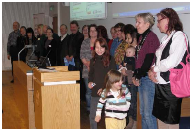
Joensuu kutsui kohtaamispaikat vuoden 2011 seminaaripäiville.