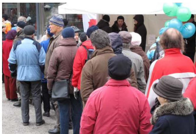
Ammattiopisto Luovin hernekeitto lämmitti mukavasti ja soppatykillä riitti jonottajia.

Yksi juhlien tarkoitus oli tehdä Kumppanuuskeskusta tutuksi kaupunkilaisille ja se tavoite saavutettiin.