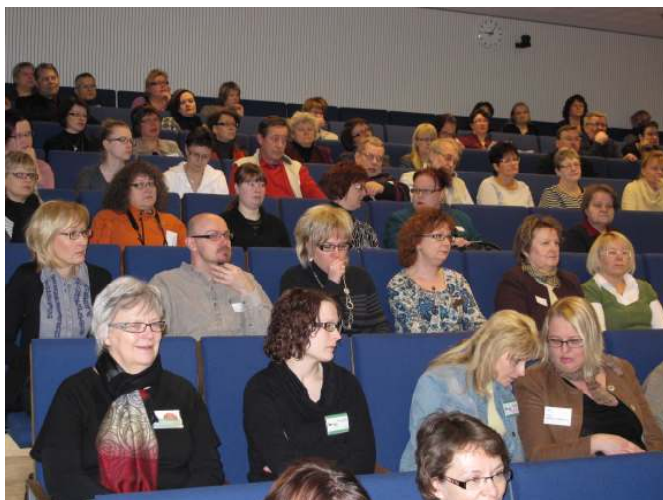
Wegeilius-sali täyttyi erilaisissa kohtaamispaikoissa toimivista ihmisistä.

Meillä on tutkittua tietoa kohtaamispaikoilla kävijöistä. Vuonna 2008 Kansalaisareena ja Espoon Järjestöjen Yhteisö sekä Sosiaali- ja terveysturvan keskusliitto toteuttivat kohtaamispaikoilla kävijäkyselyn. Kysely toteutettiin yhden viikon aikana 18 kunnan 28 kohtaamispaikassa. Yhteensä näissä paikoissa oli kyselyviikolla 1279 kävijää, joista 756 vastasi kyselyyn. Tyypillisin kävijä oli eläkkeellä oleva nainen. Muut olivat työelämässä, työttömiä, lomautettuja, opiskelijoita, omaishoitajia jne. Puolet vastaajista käy paikassa useita kertoja viikossa ja yksi neljäsosa keran viikossa. Ylivoimaisesti suurin syy kohtaamispaikalle tulemiseen oli tapahtuma, tilaisuus tai kokous sekä uusiin ihmisiin tutustuminen tai tuttavien tapaaminen. Reilu kymmenesosa haki kohtaamispaikalta apua tai tukea: vertaistukea mm. masennukseen ja muihin mielenterveysongelmiin liittyen, apua yksinäisyyteen, ruoka-apua ja asiapapereiden täyttöapua. Ihmiset siis hakevat ja saavat kohtaamispaikoista varsin monipuolista apua. Toiveitakin oli. Tietopuolista tarjontaa ja virkistystoimintaa sekä erilaisia keskusteluryhmiä voisi olla enemmän. Jyväskylässä Kumppanuustalon kävijät ovat vuonna 2005 tehdyssä kyselyssä toivoneet lisää kulttuuria. Toive nousee kulttuuritarjonnan kalleudesta ja työttömien heikoista mahdollisuuksista osallistua siihen.