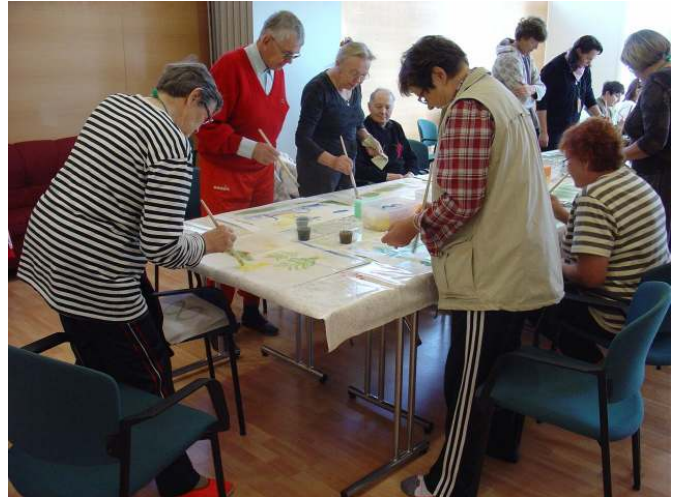
Vapaaehtoisten tuettu loma Lomakoti Onnelassa, Haukiputaalla v. 2009. (VARES-keskus)

makalenterin, johon on kerätty tiedot koulutuksista ja tapahtumista.