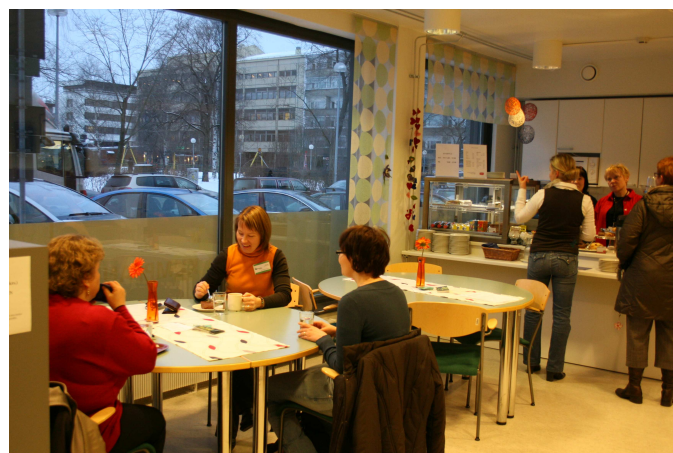
Kahvila Kamu on viihtyisä kohtaamispaikka Mannerheimipuiston kupeessa.

Yhteistyö Kumppanuuskeskuksen monien eri toimijoiden kanssa on ollut mielenkiintoista ja antoisaa ja Minnalla on jo uusia suunnitelmia ja ideoita kahvilan toiminnan kehittämiseksi. Mutta ei niistä vielä sen enempää koska avajaisethan olivat vasta kaksi kuukautta sitten, hän naurahtaa.